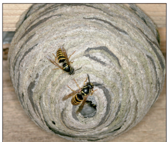
Wespennest aus zerkauten Holzfasern, Foto: J. Peters, pixelio

Wespen gehören grundsätzlich nicht zu den „besonders geschützten“ Tieren, unterliegen jedoch dem „allgemeinen Schutz wildlebender Tiere“. Dieser allgemeine Schutz beinhaltet das Verbot, ein Nest ohne vernünftigen Grund zu entfernen.