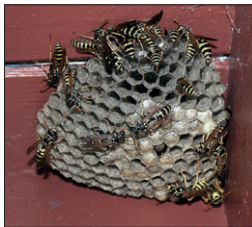
Wespen beim Nestbau

Wespennester dürfen entfernt werden, wenn ein „vernünftiger Grund“ dafür vorliegt. Eine Genehmigung der UNB benötigen Sie dafür nicht. Generell sollen Wespennester nur von einem Fachmann, z.B. von einem Schädlingsbekämpfer entfernt werden!