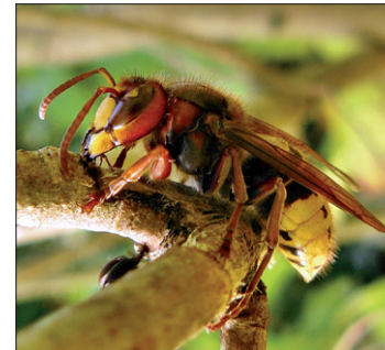
Eine Hornisse schabt Holz für ihr Nest von einem Ast

Die Hornisse gehört zu den besonders geschützten Arten. Sie bedarf unseres Schutzes, da ihre natürlichen Lebensräume immer mehr verloren gehen. Lange Zeit wurde sie aufgrund falscher Behauptungen über die Stärke ihres Giftes auch direkt verfolgt.