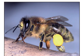
Honigbiene mit Pollen

Auch Bienen sind nach der Bundesartenschutzverordnung „Tiere der besonders geschützten Arten“. Außer der uns bekannten Honigbiene gibt es in Deutschland rund 500 weitere Arten, die als „Wildbienen“ bezeichnet werden.