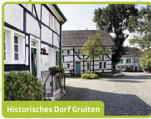
Historisches Dorf Gruitzen