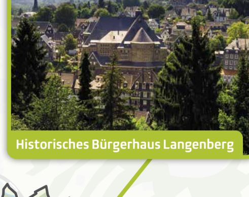
Historisches Bürgerhaus Langenberg