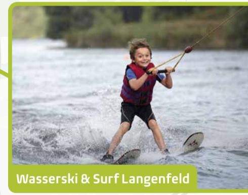
Wasserski & Surf Langenfeld