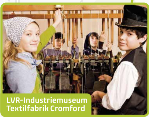
LVR-Industriemuseum Textilfabrik Cromford