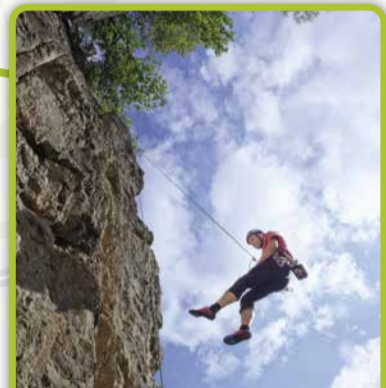
Klettern im Bochumer Bruch